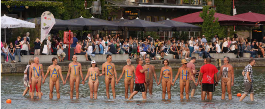
Festival „Skulptur Projekte Münster 2017“: Kunstwerk „On Water“ von Ayşe Erkmen, Berlin und Istanbul, ein BodyArt Performance -Geschenk der „Initiative Aktiver Naturisten (IAN)“, Münster (Westf.), Deutschland, 26. August 2017, © Thomas Kruse