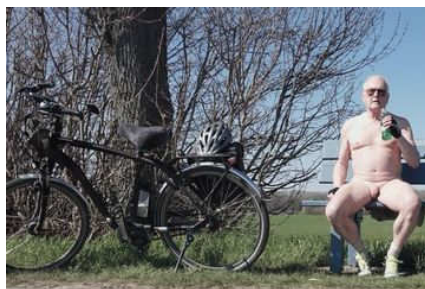
Du kannst nackt Fahrrad fahren