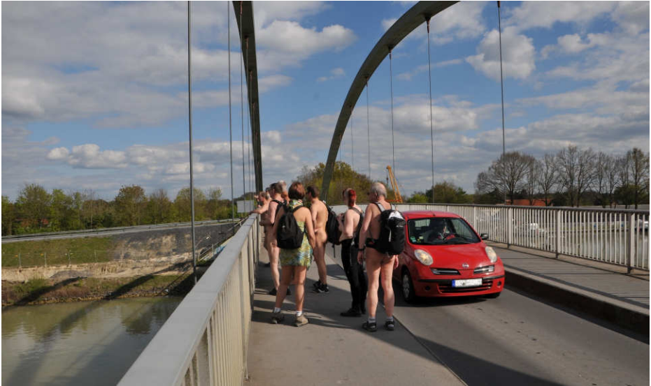
Westfälische Naturisten-Tage (WNT) 2017, Deutschland, 29. April bis 1. Mai 2017, © Horst Jerina