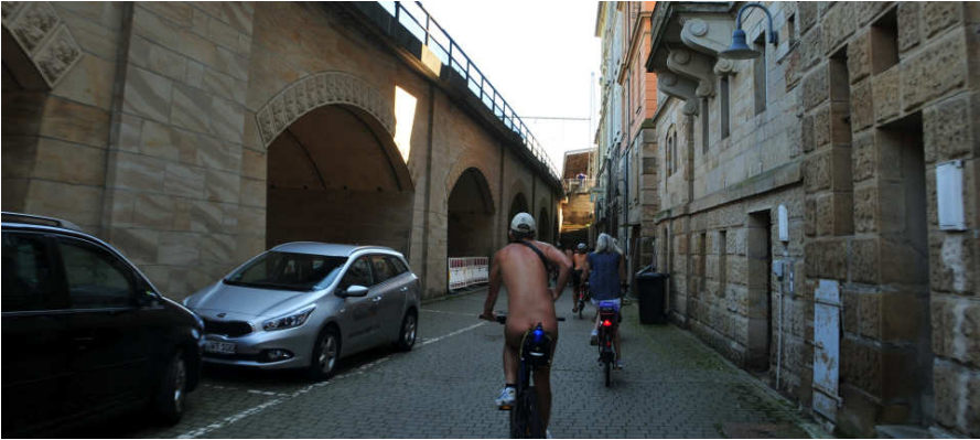
Naturisten-Tage in der sächsischen Schweiz 2017, Sachsen, Deutschland, 7 to 17 August 2017, © Horst Jerina