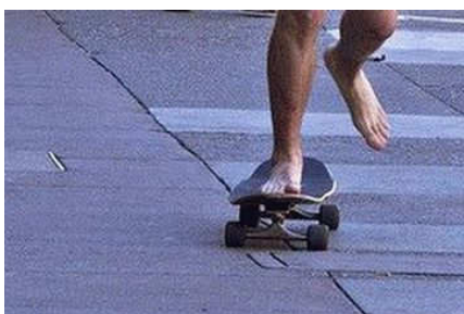
Du kannst nackt Skateboard fahren