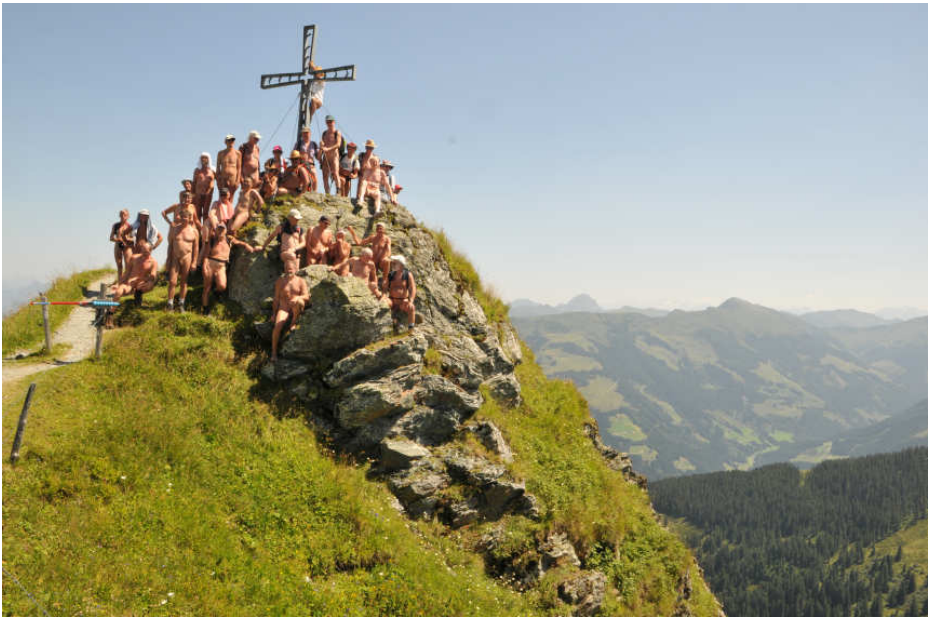
Naked European Walking Tour (NEWT) 2017, Wildschönau-Tal, Tirol, Österreich, 29. Juli bis 5. August 2017