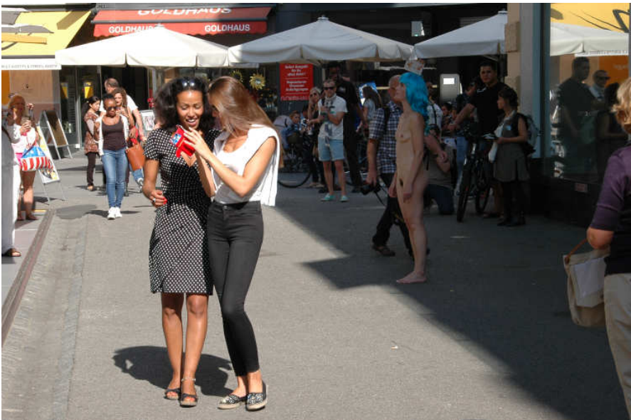
Festival „Body and Freedom – Naked Performances in Urban Space“, Schweiz / Suisse, Biel / Bienne, 2015-08-21..22