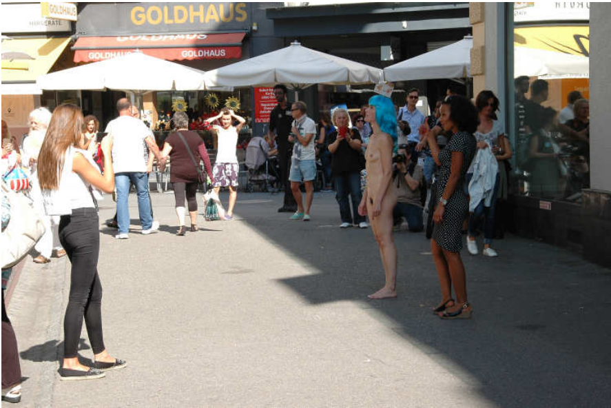
Festival „Body and Freedom – Naked Performances in Urban Space“, Schweiz / Suisse, Biel / Bienne, 2015-08-21..22