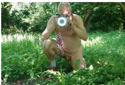
Du kannst dein Foto-Hobby nackt ausüben